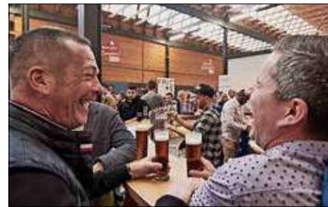
ARCH - J.-B. MOREL