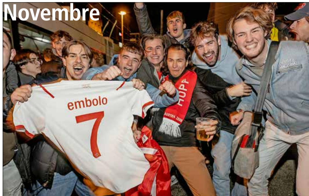
ARCH - C. RAPPPO